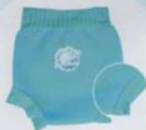
束口設計可防止寶寶的排泄物外漏。