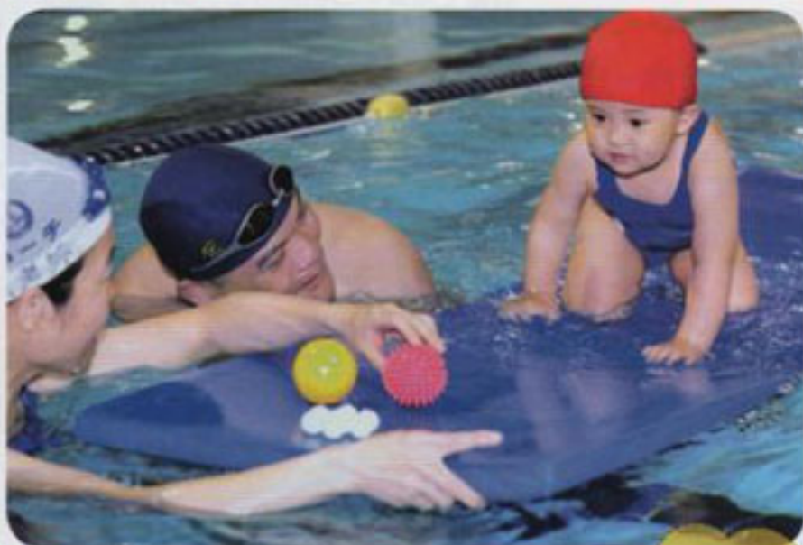
透過目標物的誘導，讓孩子在浮板上爬行等。