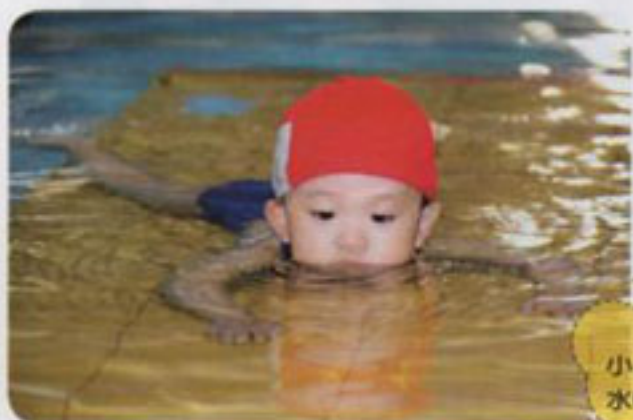
遊戲4 小鱷魚爬+ 水中吐泡泡

這個階段也可以讓孩子的嘴巴接觸到水，練習用嘴巴吐泡泡，並發出噗噗的聲音。這是讓孩子做悶氣練習前的準備，待時間成熟並在專人指導下便可引導孩子潛入水中。